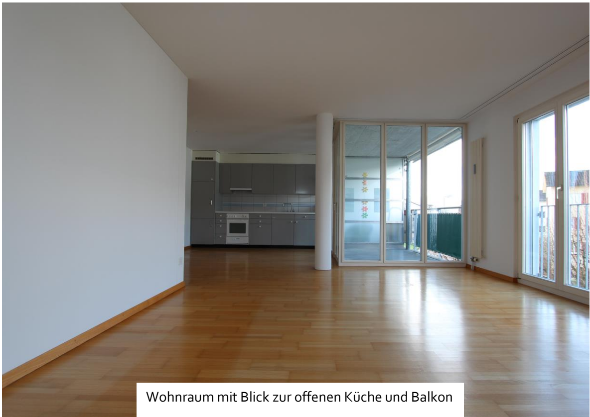
Wohnraum mit Blick zur offenen Küche und Balkon