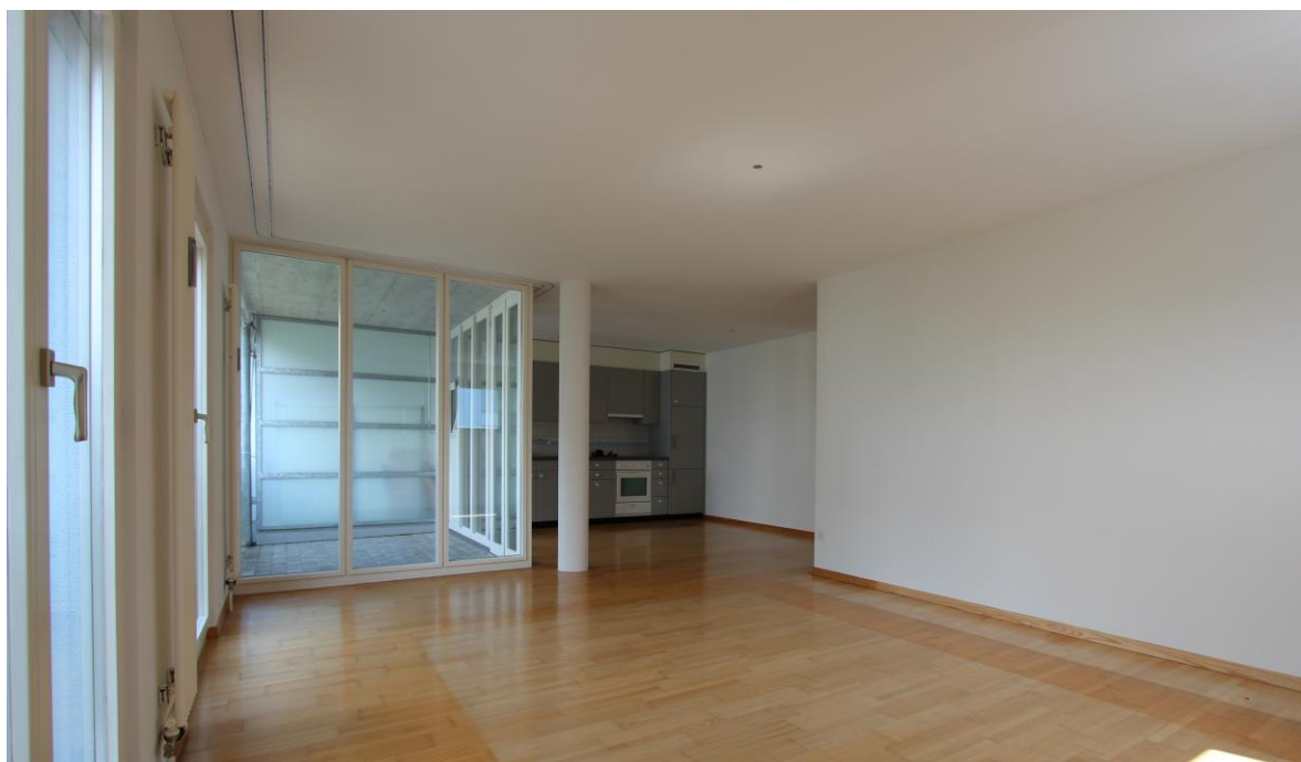
Blick von Wohnbereich in Wohnküche, links Balkon

Mietobjekt 3 ½ -Zimmer-Wohnung 3. OG, ca. 75 m 2 , Balkon