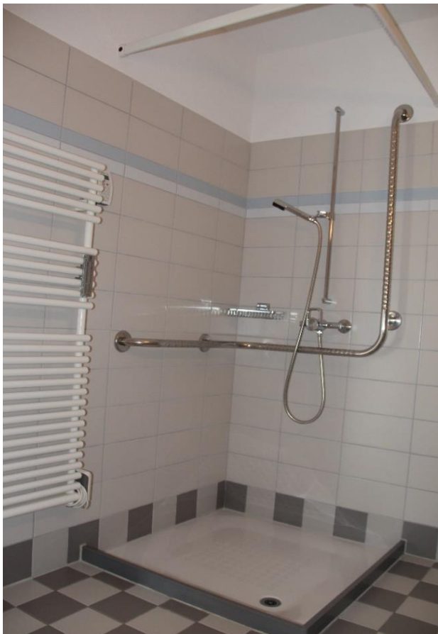
Dusche / WC