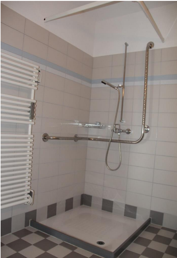
Dusche / WC