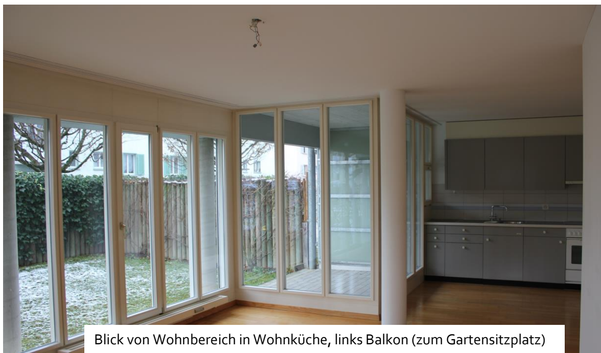
Blick von Wohnbereich in Wohnküche, links Balkon (zum Gartensitzplatz)

Mietobjekt 3 ½ -Zimmer-Wohnung EG, ca. 77 m 2 , Gartensitzplatz