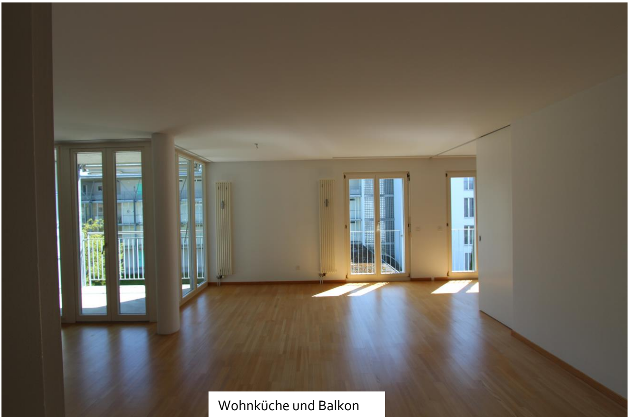
Wohnküche und Balkon