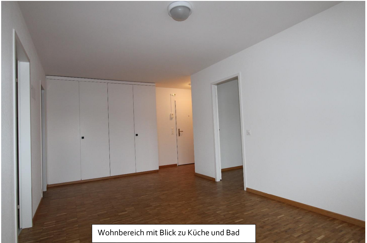
Wohnbereich mit Blick zu Küche und Bad