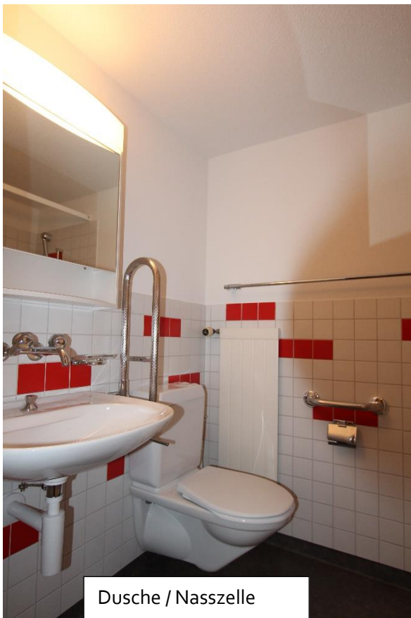
Dusche / Nasszelle